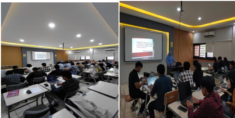
Gambar 2 . Penyampaian Materi

Tahap pelaksanaan pelatihan dilakukan melalui metode ceramah interaktif dan demonstrasi penggunaan WebGIS. Pada tahap ini peserta diberikan pemahaman mengenai konsep dasar GIS, pengenalan data spasial, serta pemanfaatan WebGIS sebagai alat visualisasi dan analisis lokasi usaha. Metode pelatihan ini dipilih karena dapat memfasilitasi proses transfer pengetahuan secara efektif sekaligus memberikan kesempatan kepada peserta untuk memahami konsep dasar sebelum melakukan praktik langsung. Pendekatan pelatihan berbasis praktik ini dinilai efektif dalam meningkatkan keterampilan peserta dalam penggunaan teknologi digital (Gorjian, 2025) kegiatan praktek analisis dapat di lihat pada gambar 2 berikut :