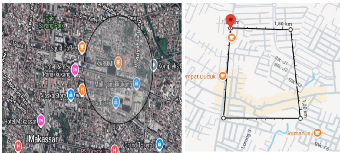
Gambar 2. Bufering lokasi UMKM

Temuan ini juga konsisten dengan berbagai penelitian sebelumnya yang menunjukkan bahwa pemanfaatan SIG dalam bidang bisnis dapat meningkatkan akurasi analisis lokasi dan membantu dalam identifikasi peluang pasar (sui et al 2011). Kemampuan peserta dalam mengidentifikasi sebaran usaha, menganalisis kepadatan, serta menentukan lokasi strategis menunjukkan bahwa pelatihan tidak hanya berdampak pada aspek kognitif, tetapi juga pada aspek aplikatif. Dengan demikian, kegiatan pengabdian ini memberikan kontribusi nyata dalam meningkatkan literasi teknologi spasial dan mendukung pengambilan keputusan berbasis data.