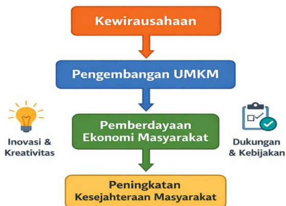
Gambar 2. Kerangka Konseptual Penelitian

Selain faktor internal pelaku usaha, dukungan lingkungan eksternal juga memiliki peran penting dalam mendorong perkembangan UMKM (World Bank, 2023; OECD, 2022). Kebijakan pemerintah, akses terhadap pembiayaan, pelatihan kewirausahaan, serta penguatan jaringan pemasaran merupakan beberapa faktor yang dapat mempercepat pertumbuhan UMKM (Nambisan et al., 2020). Sinergi antara pelaku usaha, pemerintah, dan lembaga sosial menjadi kunci dalam menciptakan ekosistem kewirausahaan yang kondusif bagi pemberdayaan ekonomi masyarakat. Hubungan antara kewirausahaan, pengembangan UMKM, dan pemberdayaan ekonomi masyarakat dapat digambarkan melalui kerangka konseptual penelitian berikut.