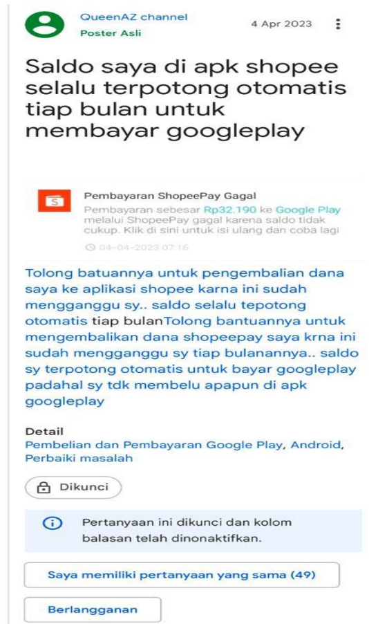
Gambar 2 Review Pelanggan Shoopee

pemotongan saldo tanpa disadari secara penuh oleh pengguna. Hal ini menunjukkan adanya keterbatasan informasi yang diberikan kepada konsumen terkait sistem yang berjalan secara otomatis.