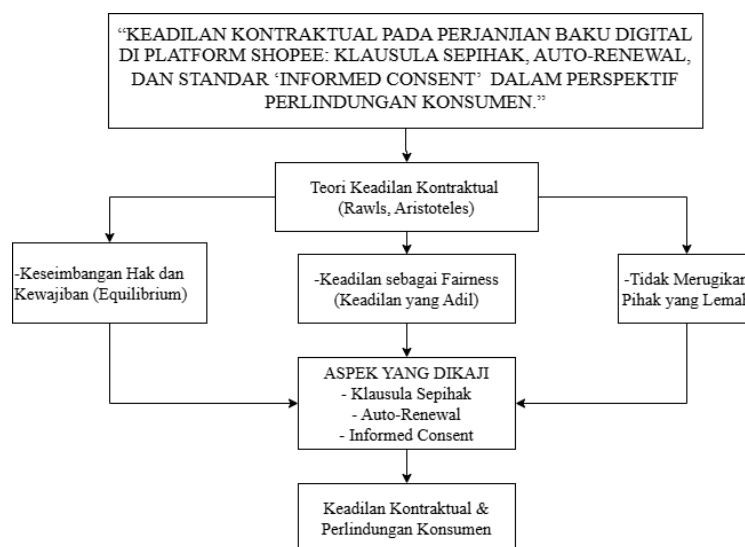
Gambar 1. Kerangka pemikiran